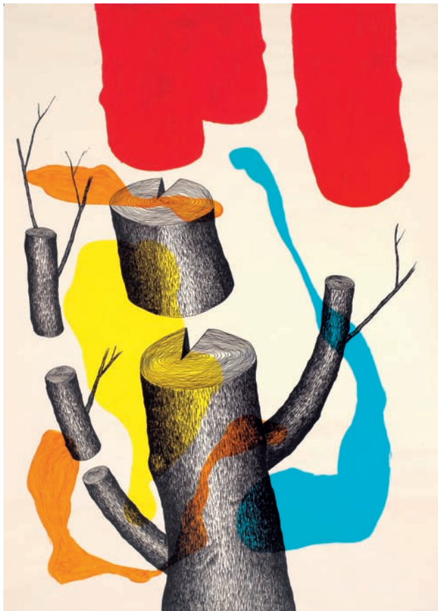
meireles de pinho